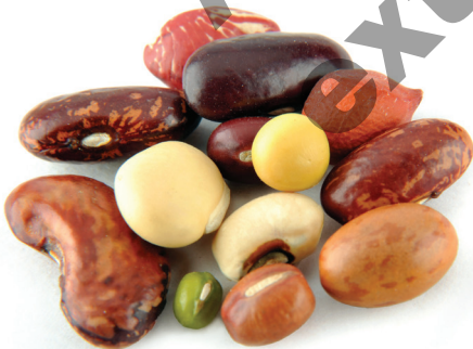
Los frijoles son una buena fuente de fibra.

Hay muchos alimentos nutritivos que pertenecen al grupo de alimentos proteicos. La mayoría de la gente piensa que los alimentos proteicos son nada más la carne, el pollo, el pescado y los huevos. Estos si son excelentes fuentes de proteínas, vitaminas y minerales. Pero también hay varias opciones en las plantas incluyendo nueces, semillas, frijoles y alimentos de soya. Es importante elegir una variedad de alimentos ricos en proteínas para que podamos obtener variedad de nutrientes.